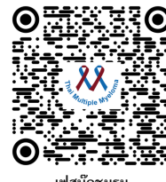
เฟซบุ๊กชมรม

หากต้องการความช่วยเหลือสามารถติดต่อครอบครัว เพื่อน และบุคลากรทางการแพทย์ รวมถึงเข้าร่วมกลุ่มสนับสนุนและขอรับความช่วยเหลือจาก ชมรมผู้ป่วยโรค มะเร็งไขกระดูกชนิดมัลติเพิลมายอิโลมา ผ่านเฟซบุ๊ก หรือ ไลน์ของชมรม